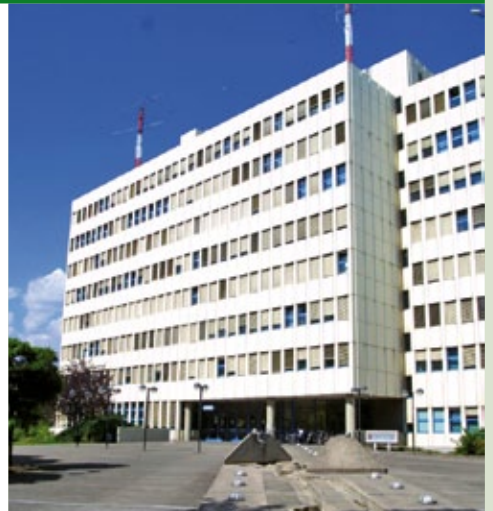
Der Sitz des Polizeipräsidiums in der Mainzer Neustadt.