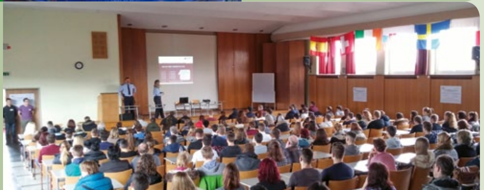
Informationsveranstaltungen waren elementarer Bestandteil des Projekts.

Das Projekt „Vielfalt in der Polizei“ lief vom 1. Januar 2012 bis zum 31. Dezember 2014. Projektträger war das Mainzer Institut zur Förderung von Bildung und Integration.